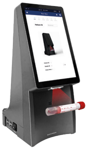
1. Proben-ID scannen.