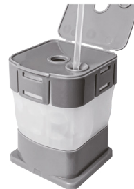
3. Sicherheitsclip entfernen. Kartusche runterdrücken. Schutzfolie perforieren. Deckel öffnen. Probe einbringen. Cartridge schließen.