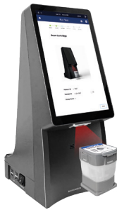
2. Cartridge Code scannen.