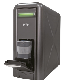
4. Vorbereitete Cartridge mit Probe in den STANDARD M10 Analyzer laden.